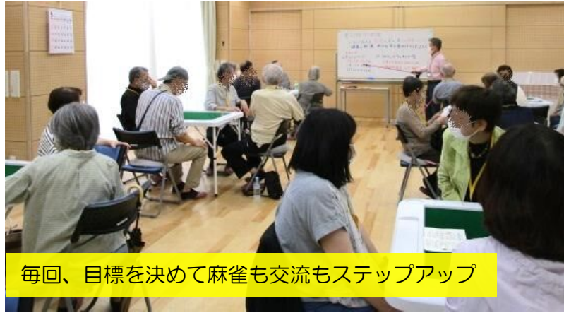
毎回、目標を決めて麻雀も交流もステップアップ

4月11日(土)・4月18日(土)・5月14日(木) マーじゃんロンポン会 共催：校区福祉保健部・飯倉中央公民館