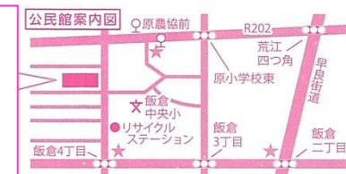
★公民館誘導案内板

福岡市飯倉中央公民館 〒814-0161 福岡市早良区飯倉3丁目19番5号 電話：092(851)3565 FAX：092(851)3578 e-mail：iikurachuou133@jcom.home.ne.jp