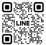
子ども講座 QRコード