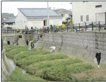
メイン会場(田隈校区)

また、今回のメイン会場の田隈小学校で開催された室見川水系一斉清掃の表彰式も行われました。