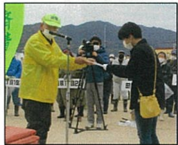
表彰式 (開会式にて)