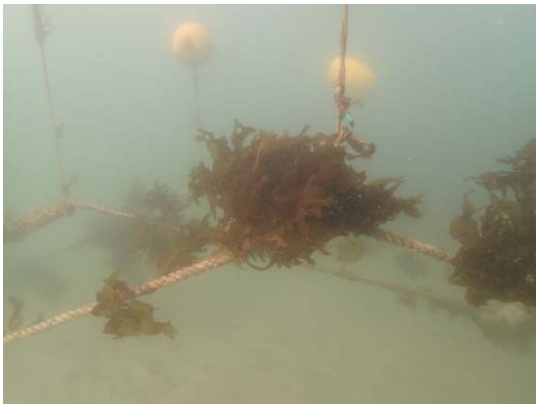
種苗(ワカメ)の設置