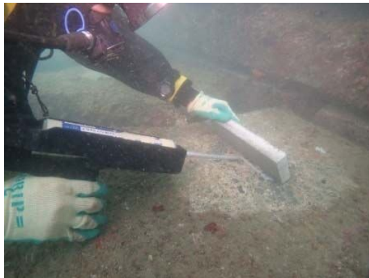
栄養塩プレートの設置