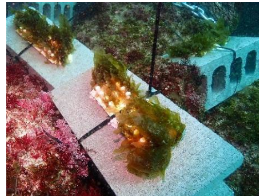
幼体(アトクメ)の設置