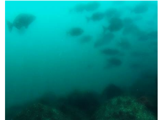
植食性魚類の蝸集調査