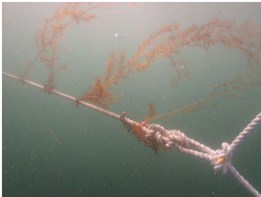
種苗（アカモク）の設置