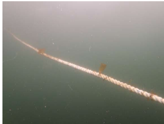
種苗（クロメ）の設置