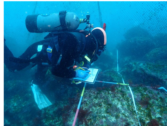
モニタリング調査