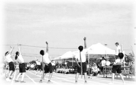
ブロック長たちによる選手宣誓の様子