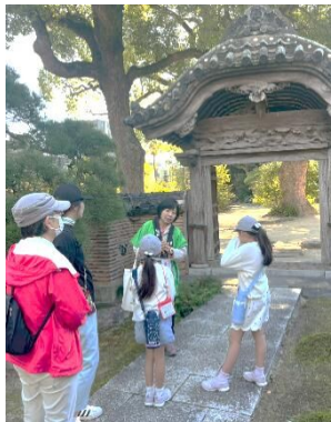
(健康づくり推進委員会)