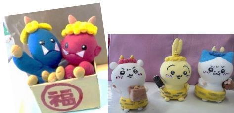
節分人形（奥元主事作）