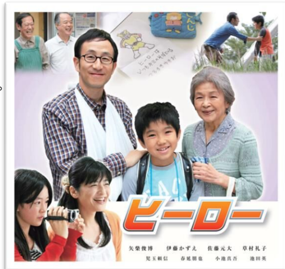
企画/兵庫県・(公財)兵庫県人権啓発協会

「無縁社会」と呼ばれる社会状況の中、私たちに何ができるのでしょうか？地域のつながりを結んでいく大切さを考えてみませんか？