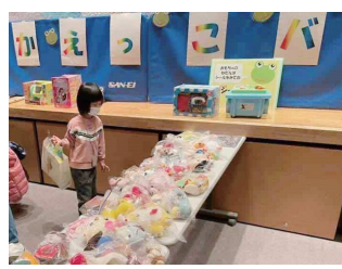
おもちゃの交換会 (かえっこバザール)