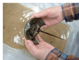
カブトガニの展示