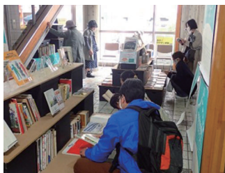
無料の古本市 (BOOKBOOK本市)