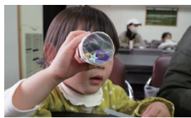
マイクロプラスチック 万華鏡づくり