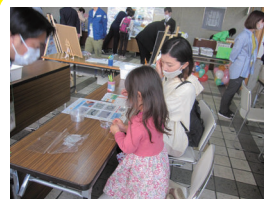
古紙でつくる ビーズプレスレット