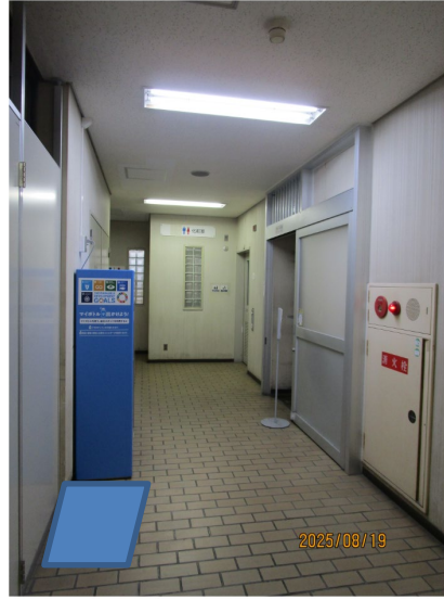
設置場所(写真) 飲 料 用 自 動 販 売 機