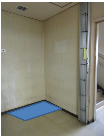
食 物 用 自 動 販 売 機 側 面 イ メ ー ジ 図