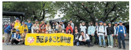
昨年度の同イベント