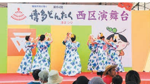
市民の皆さんによるパフォーミング(昨年度)