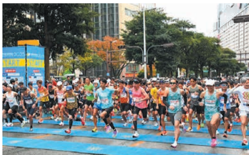
スタート地点(昨年度)

そのほか、中学生以上が参加できるファンラン、車いす競技(ともに5.2km)のランナーも募集しています。