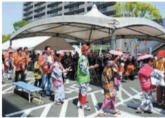
会場の皆さんで総踊りしました(昨年度)

で誰もが参加できる総踊りを行います。なお、区役所駐車場は使用できませんので、来場の際は公共交通機関をご利用ください。詳しくは、博多どんたく公式ホームページ(「どんたく西区」で検索)でご確認ください。