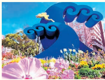
姪浜駅南口のモニュメント (トラコンキング・グラフィティ)