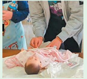
赤ちゃんのお世話体験もできます

これから父親になる人のための教室です。夫婦が協力して子育てしていくための「夫婦コミュニケーション」について学びます。※夫婦でも参加できます。