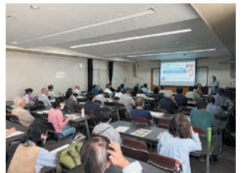
昨年度の講座の様子

なぜ、家康は江戸に幕府を? 邪馬台国とは? 節分≠豆まきなど、歴史や歳時記について、西区まると博物館推進会の会員が解説します。