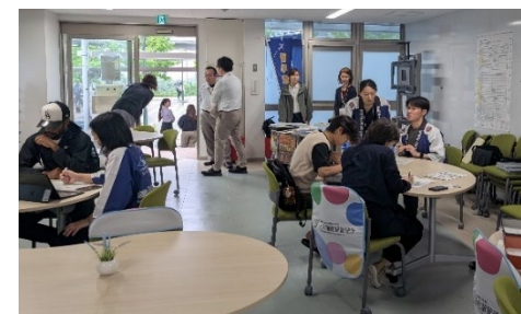
九州大学での生活相談会の様子