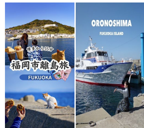
インフルエンサーによる情報発信