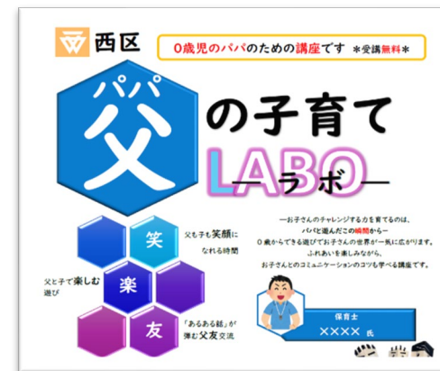
西区パパの子育てLABO