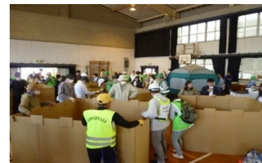
西区市民総合防災訓練の様子