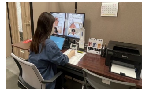
リモート窓口の様子