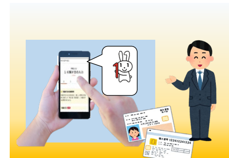
スマートフォンでの手続きをサポート