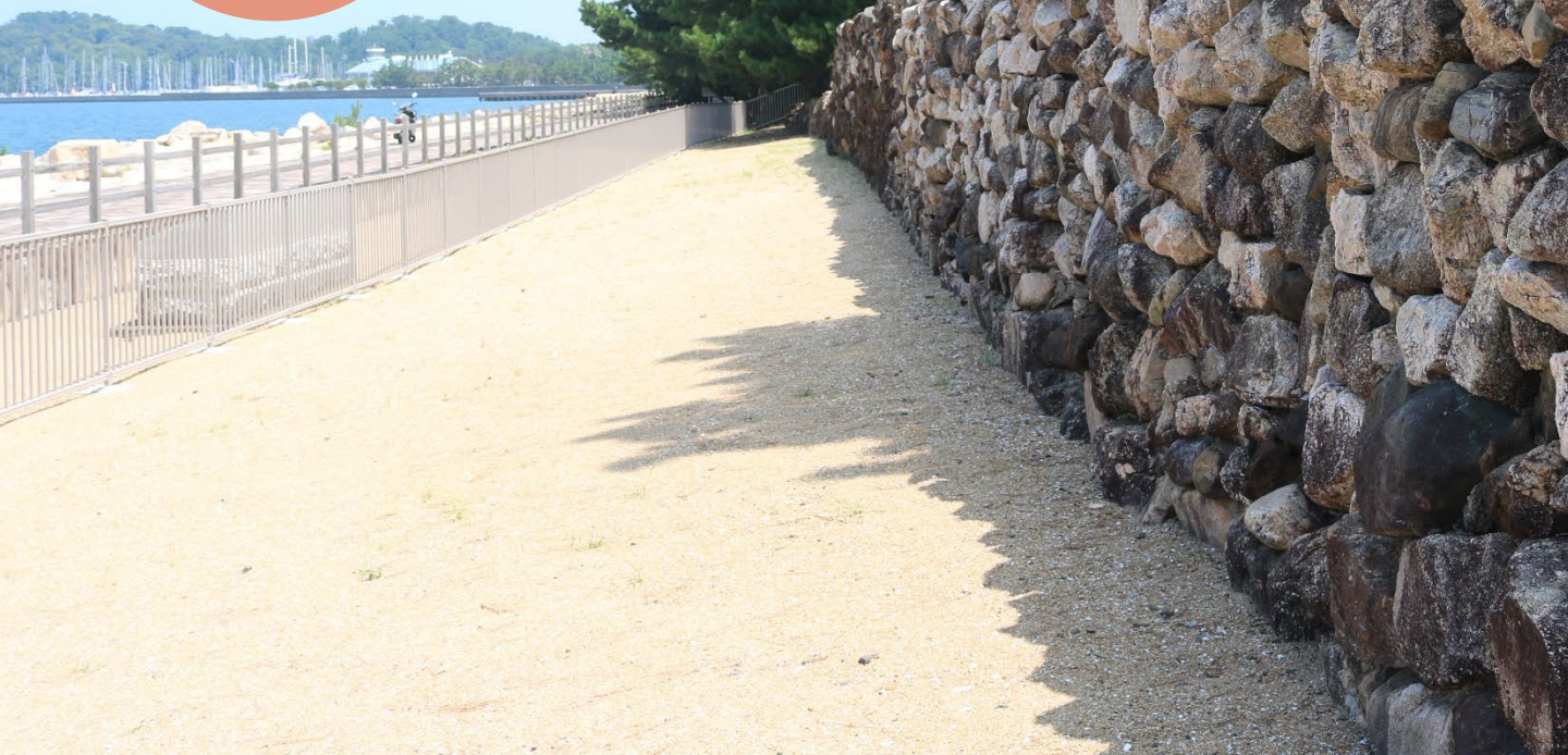
生の松原元寇防塁