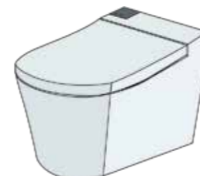
タンクレストイレ