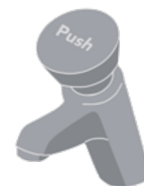
自閉式水栓 じへいしきすいせん