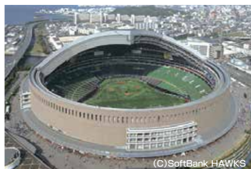
雨水を利用してのみずほPayPayドーム福岡