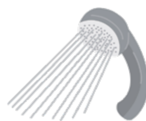
節水型シャワーヘッド

● そのほかにもある節水に役立つ器具 りょうすい ※むだな水を使わなくてすみます。