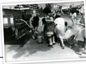
バケツに給水を受ける市民

水が出て当たり前と思ってたのに時間断水。この時以来、水は大事!!と思うようになり節水を心掛けるようになりました。