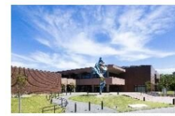
美術館コレクション展示観覧料無料 (福岡市美術館HPより)