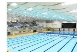
市民プール2時間無料