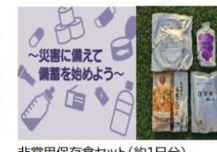
非常用保存食セット(約1日分)