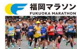
福岡マラソン優先出走権

貯めたポイントは、福岡マラソンなどの市主催イベントの優先参加権や市有施設のバックヤードツアー、美術館・市民プールなどの公共施設の割引、市の施策に関するグッズなどと交換できます。