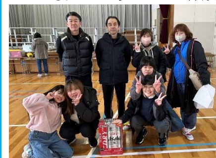
優勝した 諸岡3丁目1.2区 チームのみなさん