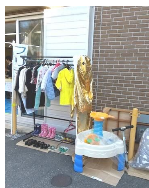
男女共同参画協議会