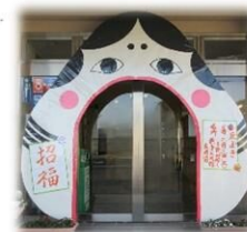
今年もお多福できました