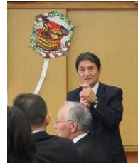
体育振興会 新飼会長