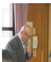
自治協議会 小金事務局長