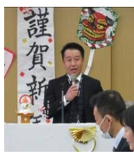
弥永西小学校 大曲教頭