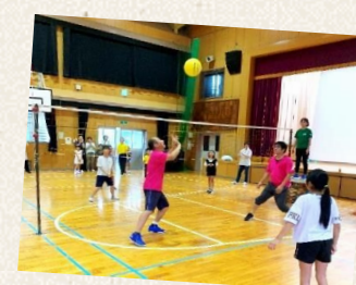
子供にもできる柔らかなボール