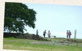
名護屋城博物館へ