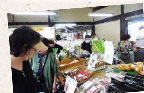
唐津うまかもん市場

ご参加いただいた校区の 皆様ありがとうございました。 公民館集合、各町へパトロール