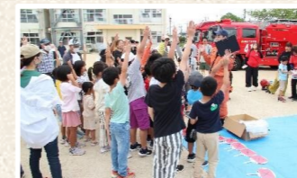
南消防署:子ども防災クイズ