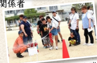
消火器操作 初期消火訓練