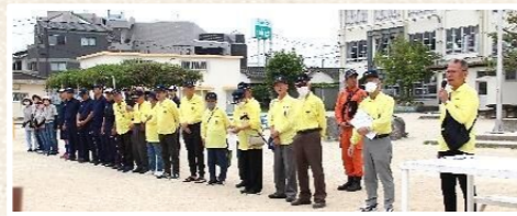
まちづくり老司協議会関係者