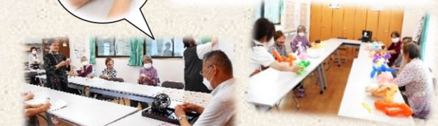
ビンゴゲームで賑わう!