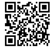
面談申込フォーム