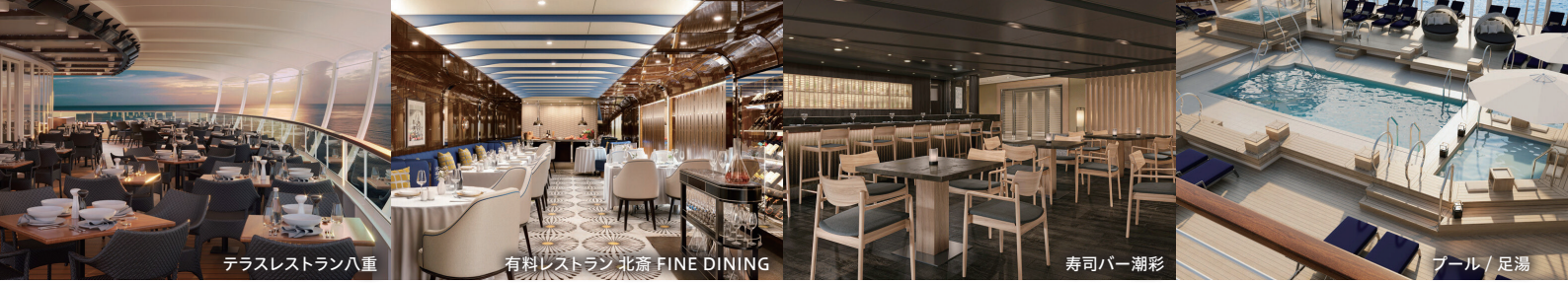
テラスレストラン八重