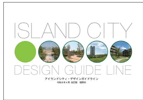
アイランドシティ・デザインガイドライン (令和8年4月改訂版)