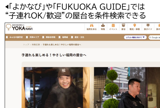
◀「よかなび」や「FUKUOKA GUIDE」では“子連れOK/歓迎”の屋台を条件検索できる