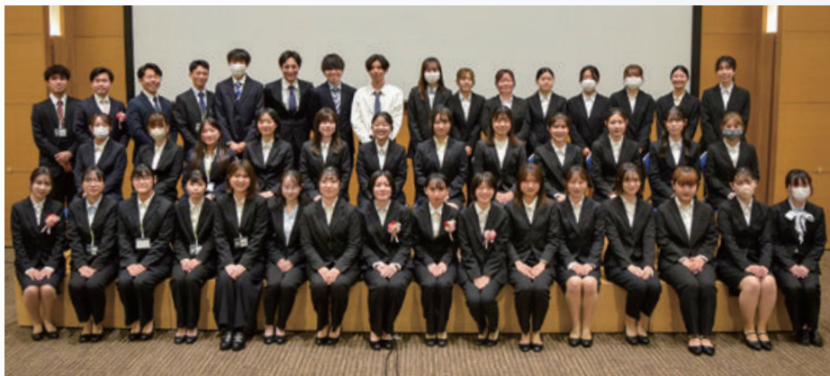
修了式 （福岡国際会議場）