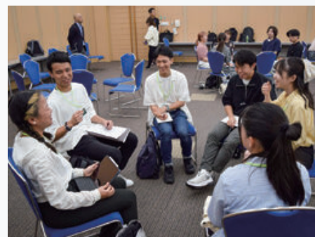
講義でのグループワークの様子 （福岡国際会議場）