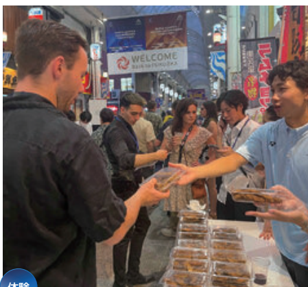
体験 国際会議のレセプション運営補助体験 （川端通商店街）