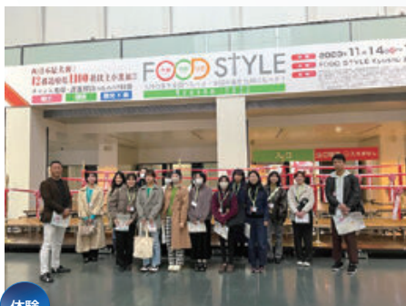
体験 大規模展示会の運営補助体験 （マリンメッセ福岡）