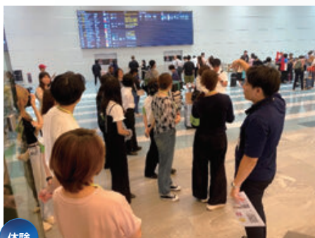
体験 福岡空港見学 （福岡空港国際線）