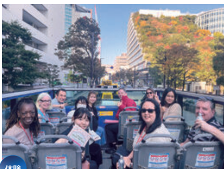
体験 MICEショーケース&FAMトリップでの案内体験 （オープントップバス）