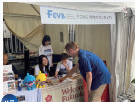
体験 世界水泳選手権開催時の観光案内体験 （博多駅前広場）