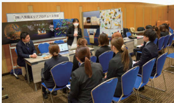
合同説明会の様子

最終プログラムでは、MICE関連企業による合同説明会を実施し、企業と学生が対面で話すことが出来る機会を提供します。