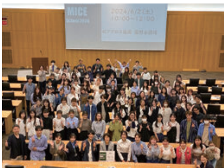
開講式 （アクロス福岡）