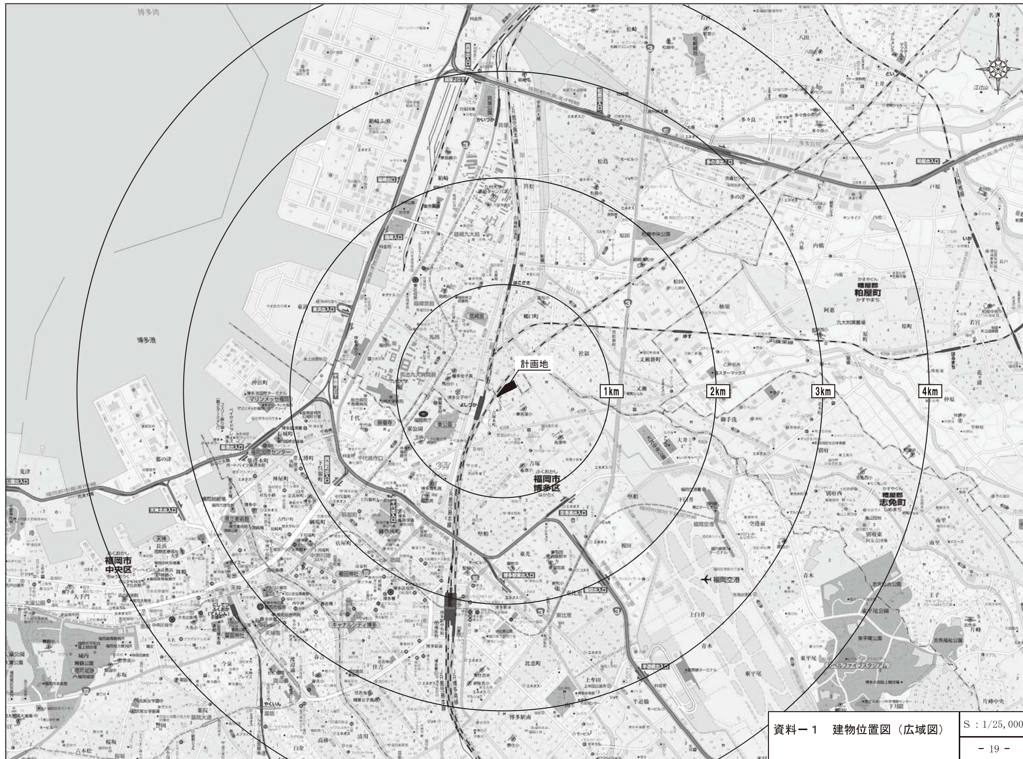
資料-1 建物位置図(広域図)