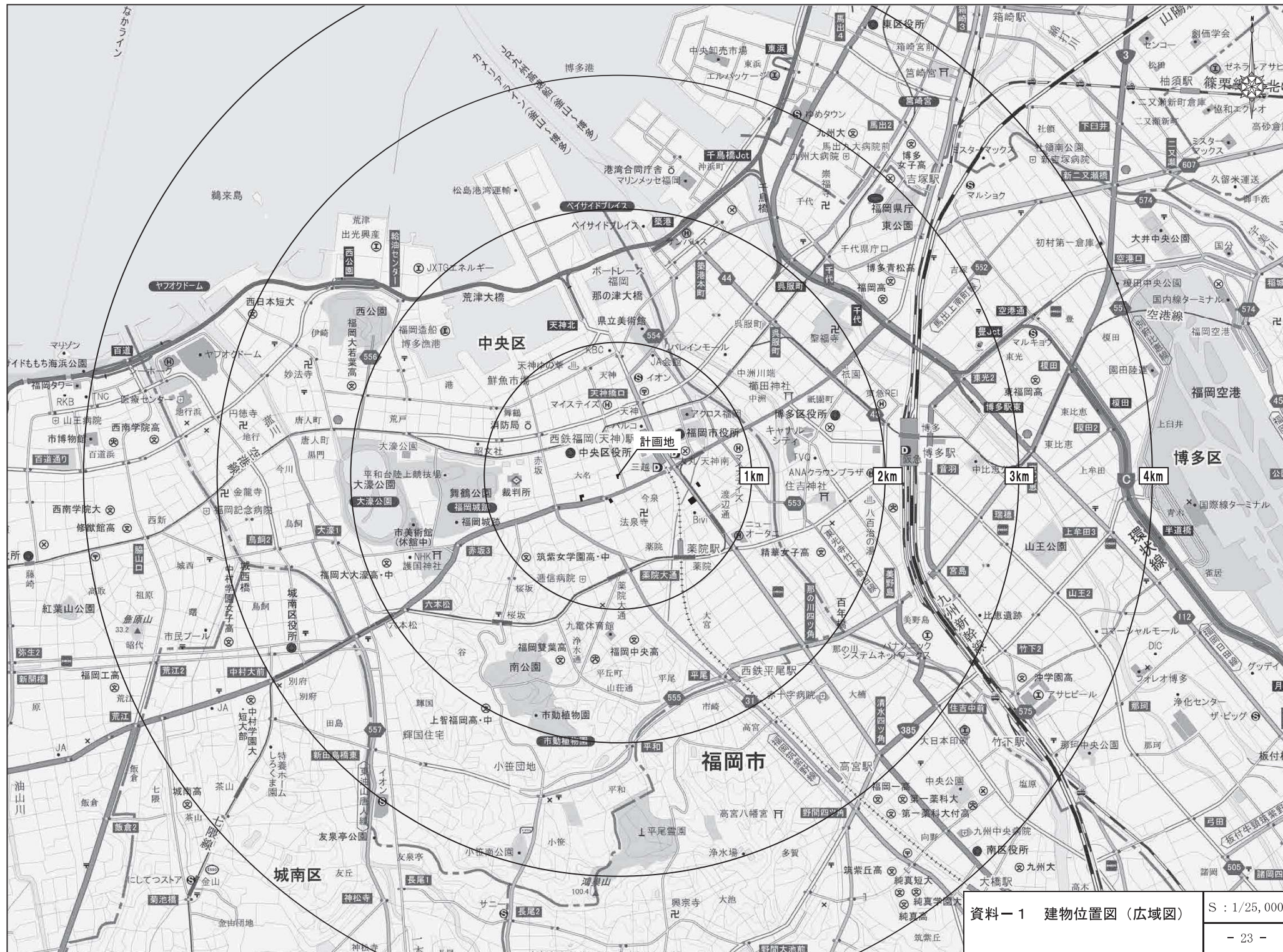
資料-1 建物位置図(広域図) S : 1/25,000