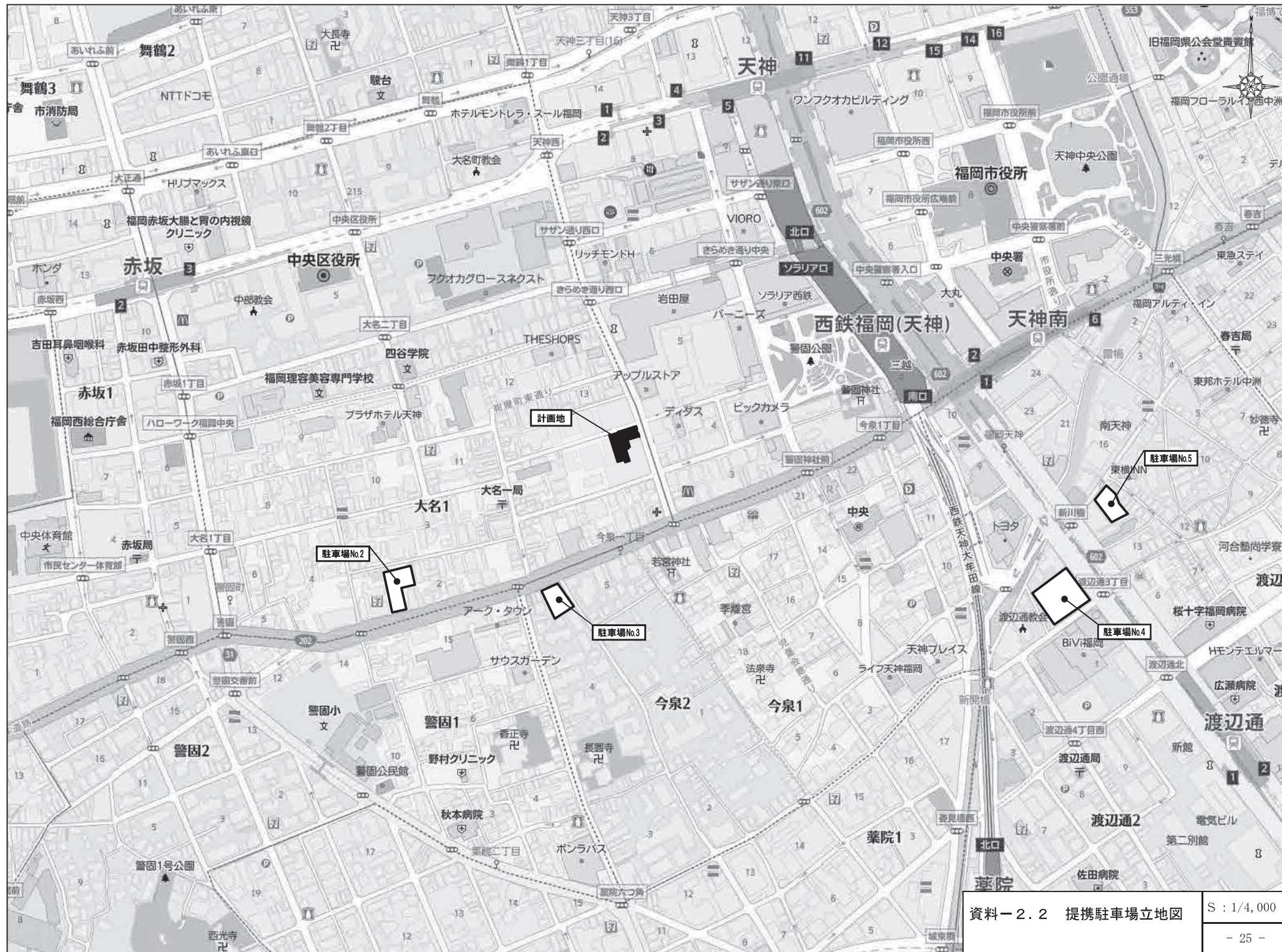
資料-2.2 提携駐車場立地図