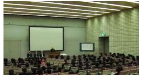
オリエンテーション (講堂) イメージ