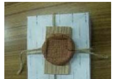
封泥「奴國王からの荷物」