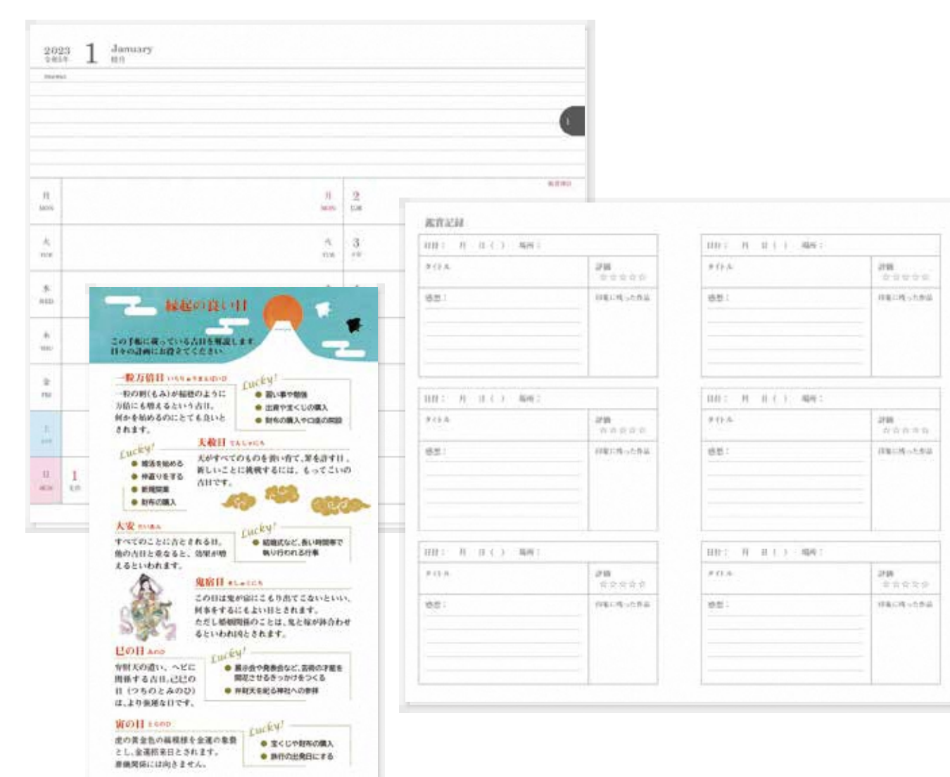
▲縁起の良い日が毎月わかる!