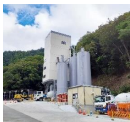
(神奈川県リニア工事現地プラント)

定置式生コンプラントで培ったノウハウを凝縮し、 震災復興事業等に貢献しております。