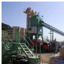
(気仙沼・南三陸復興現地プラント)