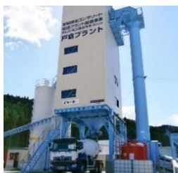
(女界島復興現地プラント)