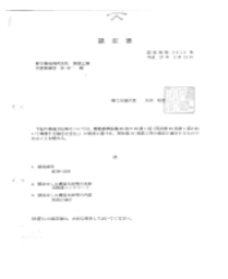
(高強度コンクリート)

徹底した商品管理のもと野方品質の最良なコンクリートを 【1年365日24時間】笑顔で対応し提供いたします。