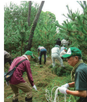
なた しよくりん かい 奈多植林会

奈多海岸の松林の再生のため、保全活動を行うほか、奈多小学校の校外活動の一環として植樹や清掃活動のサポートを行っています。