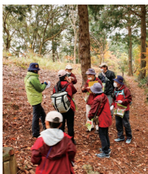
あぶらやま しぜん あんない にん かい 油山自然案内人の会

油山において、自然観察に関する情報収集や、自然観察センター主催の自然観察会等の案内を行っています。