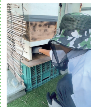
ふく おか たい がく ぶ せく おお ほう り こう どう がっ こう せい ぶつ ぶ 福岡大学附属大濠高等学校 生物部

学校屋上での養蜂や、ミツバチの生育環境整備を行い、ミツバチの保護活動を行っています。