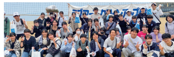
ふく おか けん りつ ふく おか こう りん かん こう どう がっ こう 福岡県立福岡講倫館高等学校

学内のほか、室見川、百道浜海岸、福岡マラソン等の地域での清掃活動に約600名もの生徒が積極的に取り組んでいます。