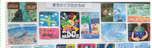
ふく おか し りつ ちく し が おか し ょう がっ こう 福岡市立筑紫丘小学校

環境問題をテーマとした「リサイクルポスター展」を実施しており、児童及び地域住民の環境意識向上につなげています。