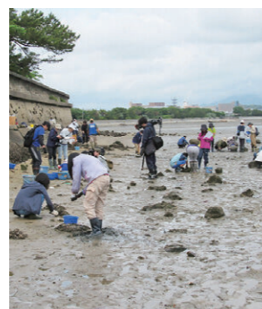
ウェットランドフォーラム

雁ノ巣および和白干潟周辺において、子どもたちが主体の生きもの観察や干潟清掃などの環境保全活動を行っています。