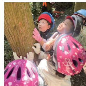
がっ こう ほう じん ふく おか よう し が く えん 学校法人福岡幼児学園 もみじ よう ち えん 紅葉幼稚園・ナーサリーライムスクール

糸島市の白糸の森で、年長児が間伐体験を行っており、子ども自身が体験から感じ考えることで自然の大切さを学んでいます。