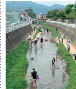
いひら こうみん かん か ていきょういっく がっぎゅう おや こじゅく 飯原公民館家庭教育学級「親子塾」

油山川において、小学生親子向けの観察会を実施し、川や植物、生きものなどの大切さを学ぶことができます。機会を提供しています。