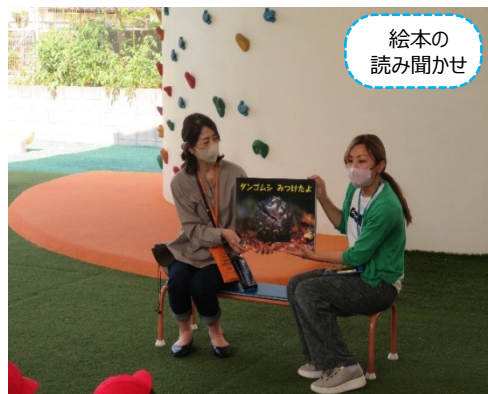
絵本の 読み聞かせ

授業では、「身近にいるけどよく知らない、ダンゴムシってどんな生きもの？」という疑問を解決するため、絵本の読み聞かせを行ったあと、実際に園庭でダンゴムシを探して、観察を行いました。