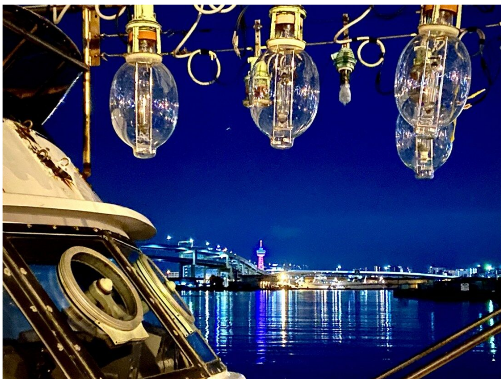
hiyomama2002 さん 夜に煌めくイカ釣り舟