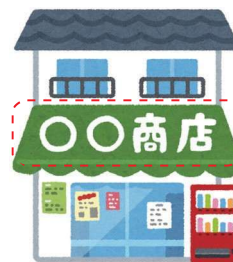
看板を設置するとき ※屋外広告物許可申請

条例で定められた規模以下のものや、行為を行う箇所によっては届出が不要なものもあります。制度の内容についてご不明な点などございましたら、下記お問い合わせ先までお気軽にご相談ください。