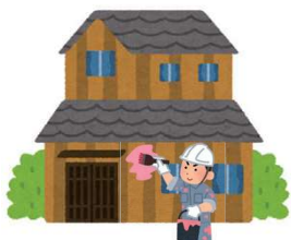
屋根・外壁を塗り替えるとき