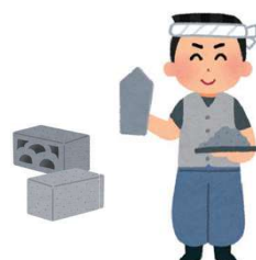
塀や生け垣をつくるとき