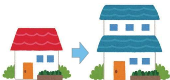
建物を増築するとき