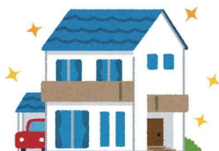
建物を新築するとき