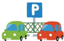
コインパーキングをつくるとき