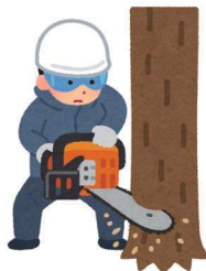
大きな木を切り倒すとき