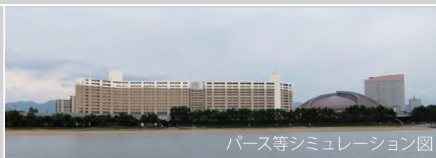
パース等シミュレーション図