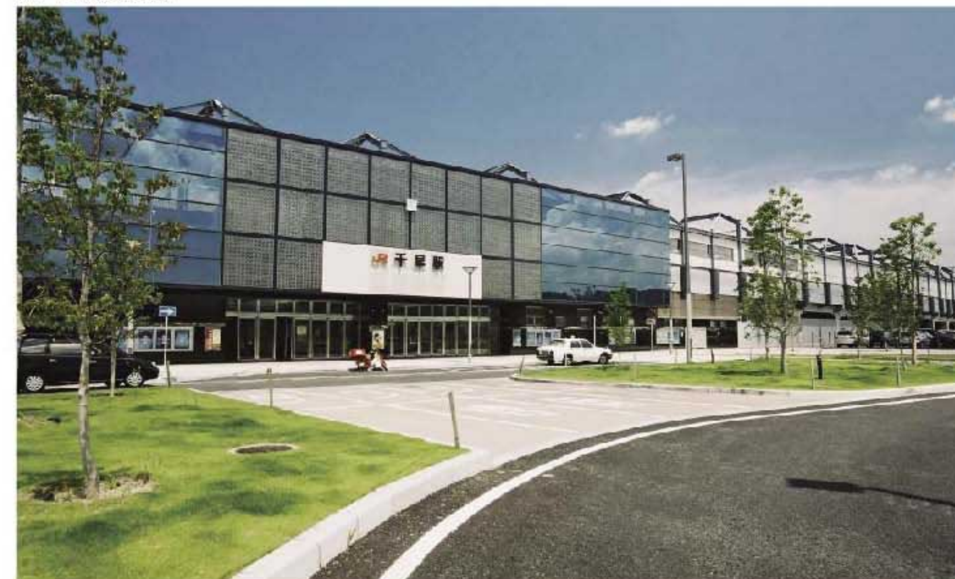
JR千早駅の駅前広場