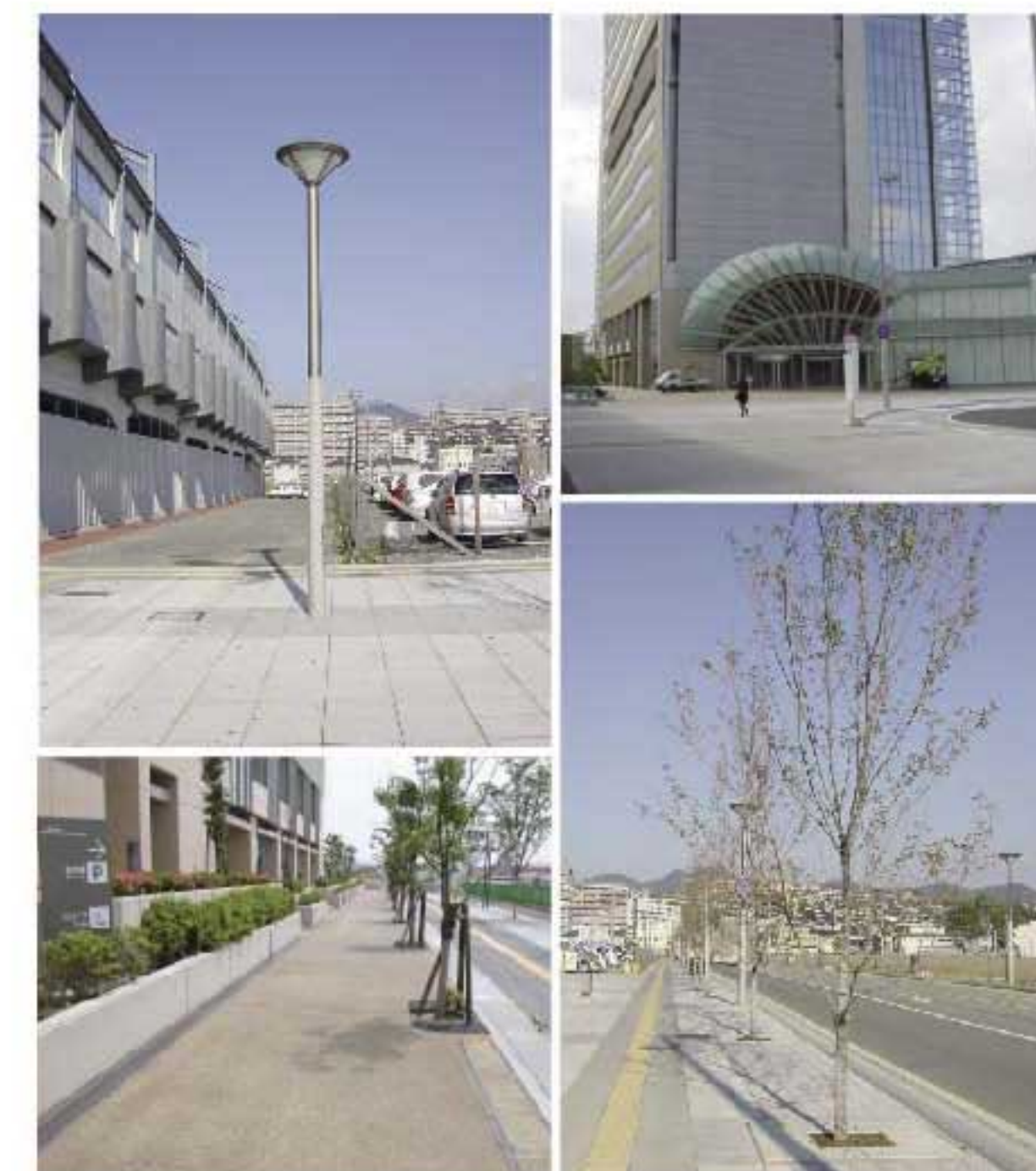
地区の中心を貫くセンターモール沿いの広幅員の歩道の街路樹と街路灯など