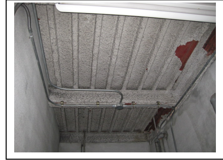
吹付けアスベストの使用例

※指定建築物とは、福岡市建築基準法施行条例 第6条の2 第1項別表第1の対象区域内（警固断層に着目した建築物の耐震対策）に存する延べ面積が1,000㎡以上の建築物。