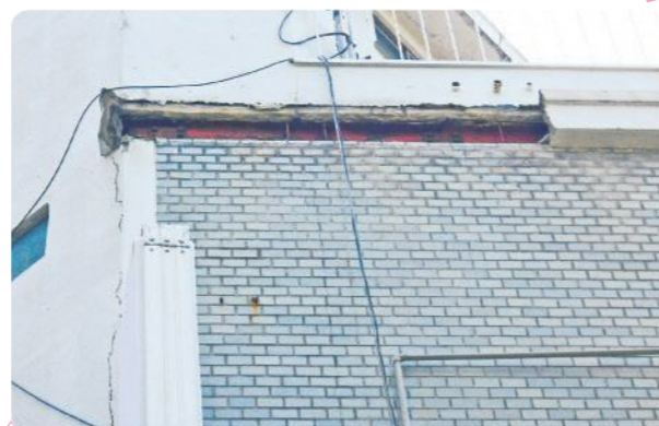
軒・ひさしの剥離・落下