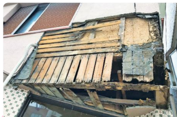
外壁の剥離・落下