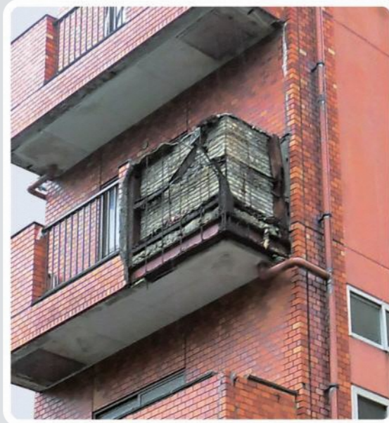
バルコニーの外壁が剥離・落下している様子

定期的な点検・補修が、その先の事故を防ぎます。この機会に、あなたの建物をチェックしましょう!