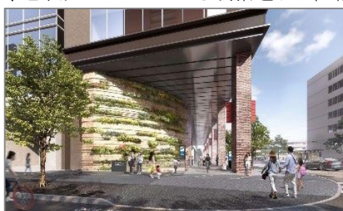
▲地上プロムナード（南棟）

地上と地下のプロムナードは明治通りと昭和通りを繋ぎ、街の回遊性を高めます。地上プロムナードは半屋外空間となっており、雨天時でも快適な歩行ができます。また、各所に配置したベンチや壁面緑化、街路樹により、福岡市が都心の森1万本プロジェクト ※3 にて目指す、憩いや安らぎを感じられる街並みの創出に貢献しています。アートが設置された明治通り側の地上と地下を繋ぐ立体広場は、地下鉄コンコースから明治通りに直結する動線を確保し、利便性の高い空間としています。