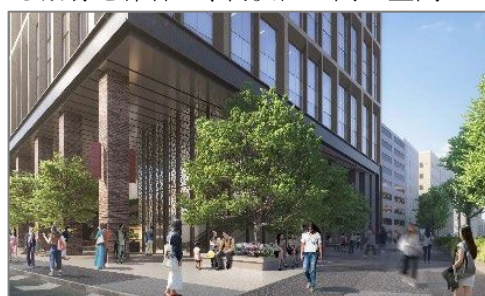
▲地上プロムナード（北棟）