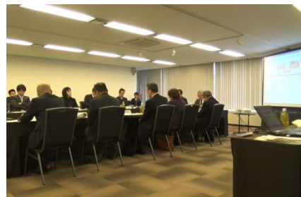
(構想委員会当日の様子)

第2回青果市場跡地まちづくり構想委員会が平成28年11月28日に開かれ、まちづくり協議会からも4人の委員が出席しました。市から、まちづくりの方向性(案)や民間意向の把握等について詳しく説明がなされました。