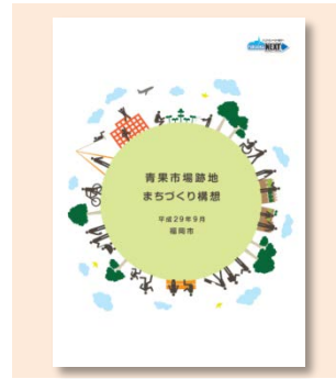
青果市場跡地まちづくり構想 (平成29年9月福岡市)

これまで、地域や学識経験者等にご参加いただいたまちづくり構想委員会において、4回に渡りご意見を頂くとともに、民間事業者の活用アイデアの募集、市民意見募集などを経て、跡地活用のコンセプトや導入する機能や空間、跡地の空間づくり及び周辺への配慮事項など、跡地活用の基本的な考え方についてとりまとめました。引き続き、本構想を踏まえ、地域をはじめ福岡市にとって魅力あるまちづくりに向け取り組んでいきます。