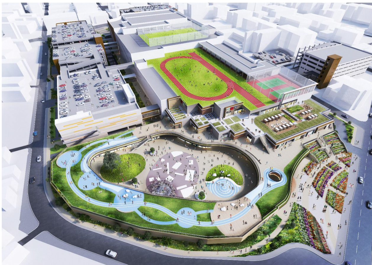
建物全体イメージ

当事業は、広場空間や商業機能を中核に、福岡・九州の魅力発信、周辺地域の生活の質の向上、開かれた場づくり等、都市機能の充実に寄与するものです。福岡市におけるまちづくりの新たな拠点として、多様な人々が集い出会う広場空間をはじめとした、コミュニティの拠点となる活気あふれる商業空間を創出するとともに、新たな生活様式に対応した施設計画とすることで、福岡市が進める感染症対応シティの取り組みや安全安心で魅力的なまちづくりに貢献してまいります。