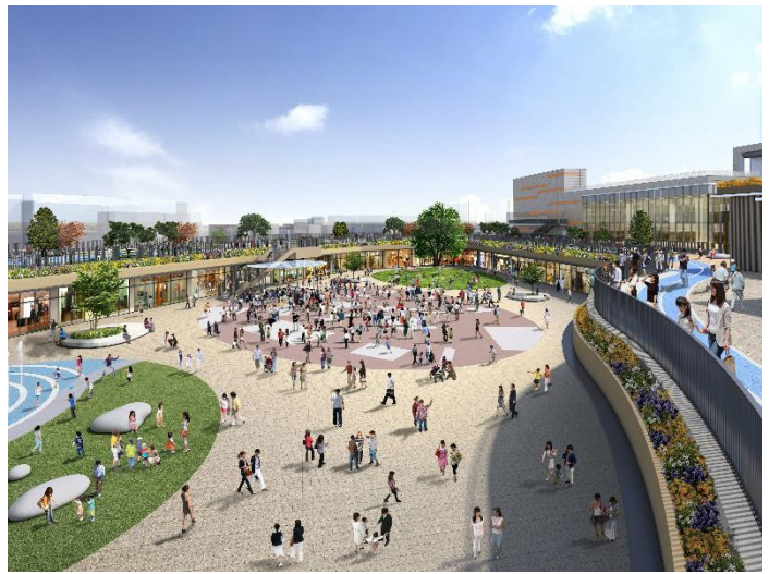
屋外広場イメージ

ファッション、雑貨、飲食、エンターテインメント施設等、話題性の高い店舗をそろえ、ファミリー層はもちろんのこと、シニア・ヤング層まで幅広い世代のお客さまが楽しめる、出会いと体験に満ちた新しい施設を目指します。