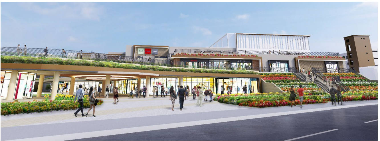
西側外観イメージ