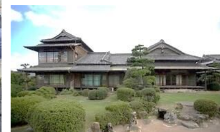
【旧伊藤伝右衛門邸】を見学