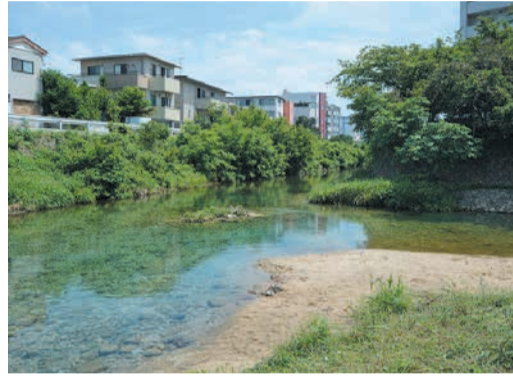
川の流れが緩やかな樋井川ビーチ

📅7月26日(日)午前10時～正午(受付は9時30分)から📍樋井川ビーチ(友丘二丁目) 📍区内に住む小学生と保護者📄抽選15組📄無料 📅7月10日(金)までに、区ホームページから申し込みを。 🗨問い合わせ先 区企画振興課 ☎833-4009 📠844-1204