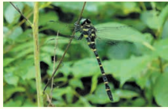
ヤブヤンマ (油山市民の森)