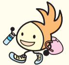
区のシンボルキャラクター 油山の妖精「ニコリん」

〒814-0192 城南区烏飼六丁目1-1 窓口受付時間：午前8時45分～午後5時15分 (土・日曜・祝休日・年末年始を除く) 区ホームページは「福岡市城南区」で検索