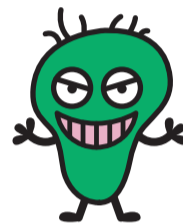
区のシンボルキャラクター 0157の王様「ワルもん」

生食や加熱不十分な肉による食中毒が多発しています。重症化することがあり、子どもや高齢者は特に注意が必要です。新鮮な肉でも生やレア焼きで食べることは危険です。中心部までしっかりと加熱して食べましょう。