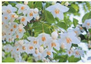
エゴノキ (油山市民の森)