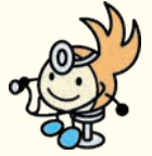
区のシンボルキャラクター 油山の妖精「ニコりん」

〒814-0192 城南区烏飼六丁目1-1 窓口受付時間：午前8時45分～午後5時15分 (土・日曜・祝休日・年末年始を除く) 区ホームページは「福岡市城南区」で検索