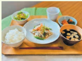
一汁三菜のランチ

【営業時間】午前11時から午後2時まで(午前11時30分から午後1時まででは学生専用) 【店休日】土・日・祝休日・その他学校が定めた休日