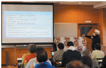
地域活性化を考える会での発表