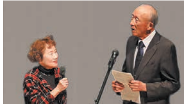
息の合った発表でサミット会場を沸かした森田自治協議会副会長(左)と石橋自治会長(右)